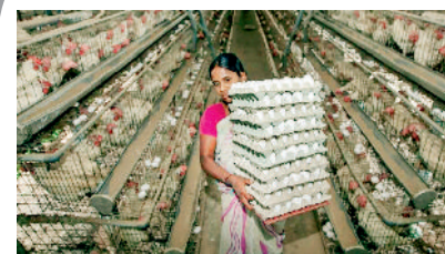
रोज एक करोड़ अंडे जाते हैं कुवैत

छत्तीसगढ़ के पोल्ट्री कारोबारियों के मुताबिक अपने राज्य छत्तीसगढ़ से अने कुवैत या अन्य किसी देश में अंडे नहीं जाते हैं, लेकिन दक्षिण के राज्यों से जरूर रोज एक करोड़ अंडों का स्टॉक कुवैत जाता है। इसका जाना अब युद्ध के कारण बंद हो गया है। ऐसा होने से कुवैत अंडे भेजने वाले राज्य अपने अंडों की खपत देश के दूसरे राज्यों में कम कीमत पर कर रहे हैं तो छत्तीसगढ़ से अंडों का दूसरे राज्यों में जाना कम हो गया है। छत्तीसगढ़ से रोज 40 से 45 लाख अंडे दूसरे राज्यों में जाते हैं, इसका आधा ही अब दूसरे राज्यों में जा पा रहा है। इसी के साथ अपने राज्य में भी गर्मी के कारण खपत कुछ कम हो गई है तो रोज प्रदेश में 20 लाख के आस-पास अंडों का स्टॉक बच रहा है।